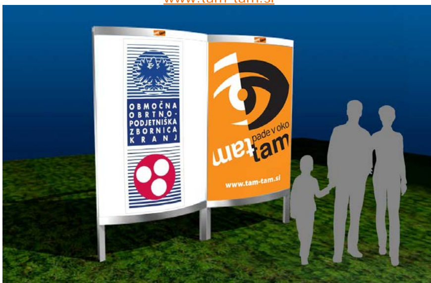
Na sliki: primer dvostranskega plakatnega panoja v primerjavi z mimoidočimi.

E: natasa@tam-tam.si // T: +386 (0)1 51 95 188 // M: +386 (0)31 361 744 // www.tam-tam.si